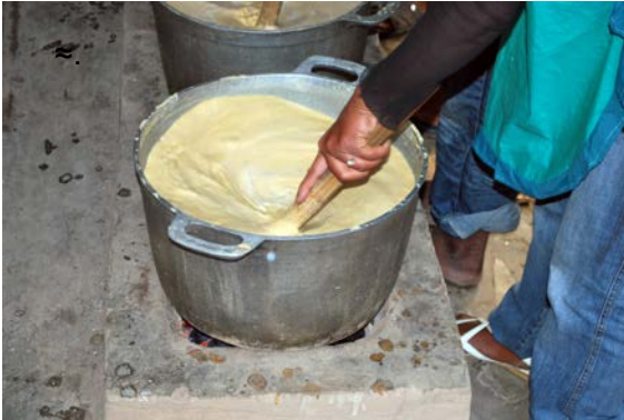
Un marmite de Koba Tsinjo prêt à être servi aux 330 élèves du matin