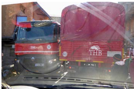
← Photos prises de la place à côté du chauffeur du car.

Sur les routes nationales, pas plus larges qu'une route cantonale suisse, les chauffeurs=> de 40 tonnes et plus croisent avec beaucoup de précautions un jour de marché dans un village, tout comme en pleine campagne !